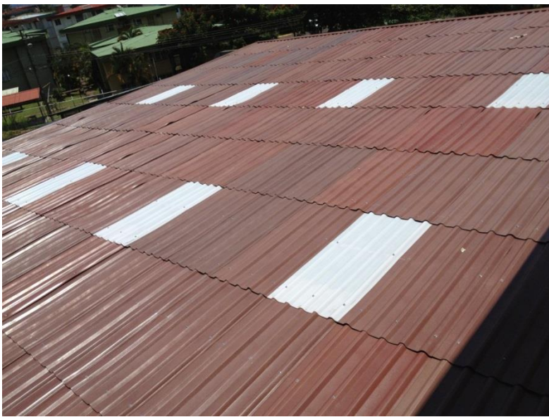
Lámina Plástica Tipo Zinc Canal Rectangular Libre de mantenimiento