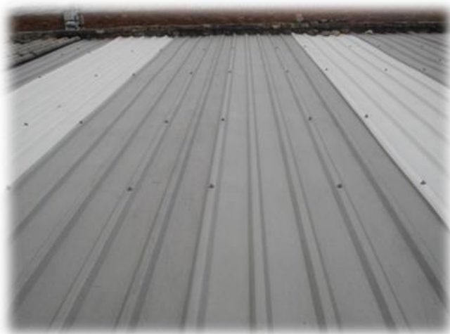
Lámina Plástica Tipo Zinc Canal Rectangular Libre de mantenimiento